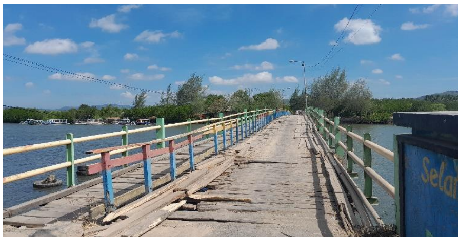
Gambar 1. Jembatan Akses Utama Pantai Cemare.

Pantai Cemare dikelola oleh Kelompok Sadar Wisata (Pokdarwis), Pokdarwis merupakan kelompok swadaya masyarakat yang memiliki kepengurusan dan pada hakikatnya juga merupakan lembaga masyarakat yang didukung penuh oleh pemerintah Desa. Namun Pantai Cemare memiliki kekurangan dalam akses jalan, kebersihan pantai hingga fasilitas seperti mushola dan toilet (Data primer diolah peneliti, 2024). Jembatan penyeberangan sebagai satu-satunya akses jalan terlihat rusak dan rapuh, ini menjadikan sebagian pengunjung wisata bahkan penduduk asli Pantai Cemare mengeluh. Hal ini juga disampaikan oleh Ketua RT di Dusun Cemare, hanya ada satu akses jalan menuju pantai cemare yaitu melewati jembatan yang terbuat dari kayu-kayu sehingga seringkali wisatawan merasa kesulitan jika melewatinya (Data primer diolah peneliti, 2024).