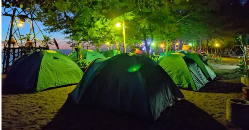
Gambar 3. Camping Ground Malam Hari di Pantai Cemare